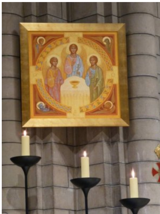
Icône peinte par notre atelier et présentée dans la cathédrale de Monaco

Les divisions humaines ne peuvent toucher l'intégrité de l'Unité Divine.