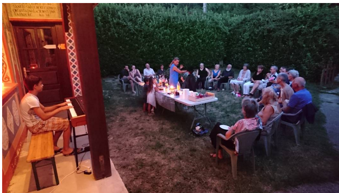
Une soirée "détente" autour d'un verre de l'amitié