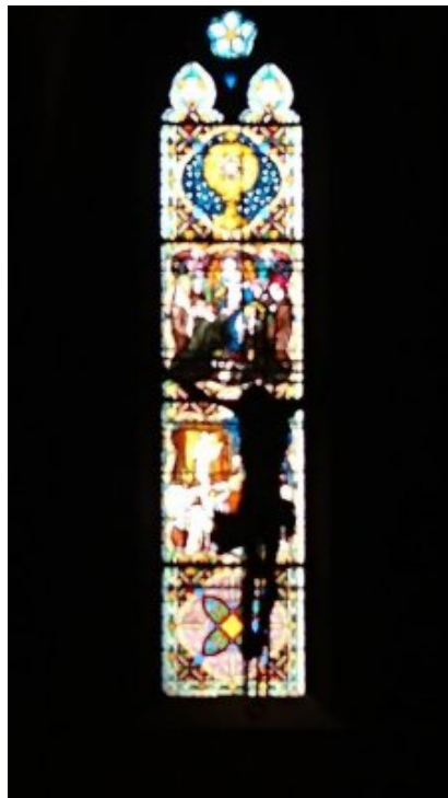
le Corps du Christ est comme une chrysalide vidée de la mort qui nous permet de participer à la Divinité

Le groupe composé de personnes issues de diverses origines (russe, vietnamienne, hongroise, slovaque, japonaise, française, allemande ...) a travaillé de manière assidue pendant 4 jours. Le temps de travail était entrecoupé par les offices de la communauté des soeurs bénédictines de Rosheim qui nous accueillait.