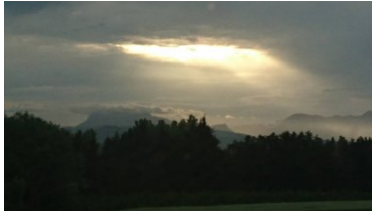
Faisceau de lumière sur la Bourgogne

Les liens avec l'histoire iconographique de la France et de l'Europe en général sont fondamentaux pour ceux qui peignent des icônes sur cette terre.