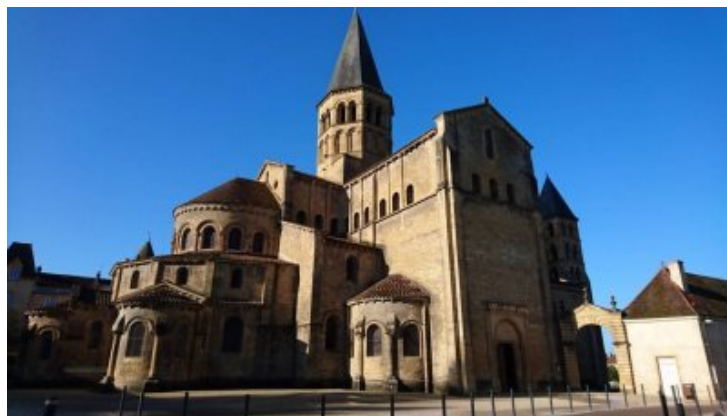
La basilique "orthodoxe" de Paray-le-Monial

En travaillant durant 4 jours au cœur de la Bourgogne "orthodoxe" (c'est-à-dire empreinte du témoignage de l'histoire sacrée de l'église indivise) nous sommes portés nous mêmes, catholiques et orthodoxes, à oeuvrer au témoignage de cette foi indivise.