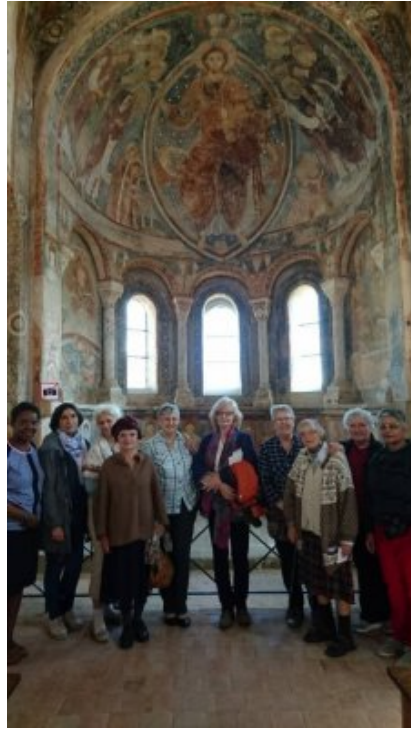
Visite de la chapelle orthodoxe de Berzé la ville