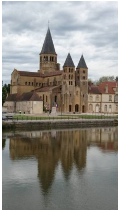
Entre terre et ciel