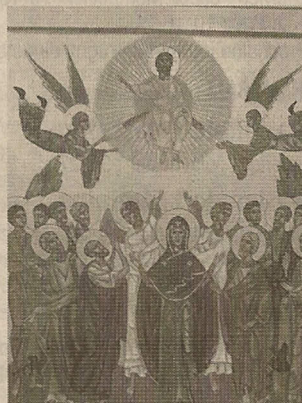
Certaines œuvres exposées sont celles de débutants, d'autres sont réalisées par des iconographes expérimentés.

Toutes les icônes présentées à l'espace Nicée sont d'ailleurs issues de l'atelier Saint-Jean-Damascène, créées soit par des débutants, soit par des iconographes confirmés. « L'icône, c'est une théologie en images », assure Yves Chauché. « On n'y