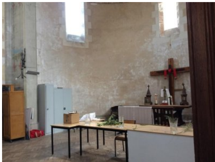
Le chœur de l'église qui servait plutôt de lieu de rangement avant la session

Entre vents et marées, au milieu de la tempête que les « eaux d'en haut et d'en bas » ont déclenché sur le bassin d'Arcachon, nous avons mené à bien cette extraordinaire expérience de réaliser ensemble une fresque de plus 60 m 2 en 5 jours.