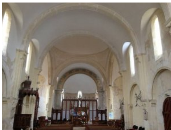
église St Elme