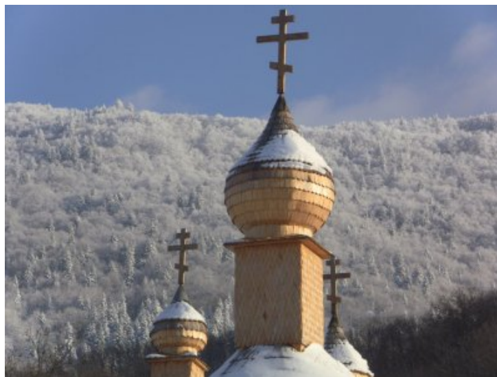
coupoles de notre chapelle de Tous les Saints dans le Vercors

Noël brille de milles feux dans nos coeurs quand les anges acclament la nouvelle de la Naissance du Christ. L'étonnement ouvre l'espoir de la foi : nos coeurs de pierre se transforment en coeur de chair, La Nativité du Christ permet d'appréhender la réalité du monde par la fragilité de Sa grandeur : comment le Créateur du Ciel et de la terre peut-il devenir la créature qu'il a créé ? Ce petit être emmailloté de langes est le Christ Dieu Créateur et Homme-Dieu. Dieu se révèle dans la faiblesse comme dans une brise légère... Nous nous réjouissons durant ces fêtes, nous gâtons nos enfants de milles cadeaux car l'Enfant roi est né. Pourtant, nous ne devons pas oublier toute la fragilité de ce monde qui est celle même de l'enfant. Nos erreurs, nos fautes, nos "bêtises" ne sont pas condamnées par Notre Père, mais Le plonge dans la compassion. La vie passe et disparaît quand elle n'est pas construite selon l'Amour. Elle participe à la corporéité éternelle de l'Amour qui ne se finit pas dans le tombeau quand elle est participation au don de soi.